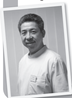
堀齒科医院 日野町松尾2丁目25番地 ☎0748-53-3520