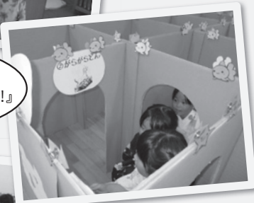
『図書館に絵本めいろあわわ!!』