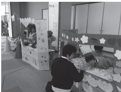
幼稚園と小学校一緒に発表会