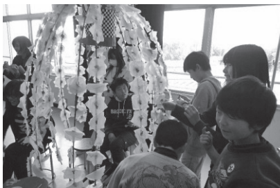
地域の伝統 ほいのほりづくり

特に今年は、「ふるさと日野の歴史」を全学校に配布し、歴史や総合的な学習で大いに活用しました。