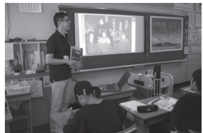
「ふるさと日野の歴史」出前講座