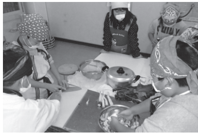
栽培した日野菜で日野菜づけ

町内の各小学校では、古くからの町並みをウォークラリーして探究学習をすすめたり、日野菜の栽培や種の収穫をしたり、全校で綿向山登山をするなど、それぞれの地域性をいかした「ふるさと学習」に取り組んでいます。