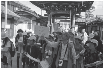
日野歴史ウォークラリー