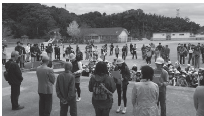
スクールガードの皆さんへのお礼

はじめての試みでしたが、多くの方にご参加いただき、子どもたちは緊張しながらも、張り切って活動していました。