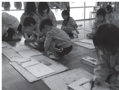
元気いっぱいお絵かき

11月5日(中学校)と20日(幼稚園・小学校)に、保護者や地域の皆様に学校・園を公開し、ふれあい交流する機会として「地域ふれあいDAY」を開催しました。