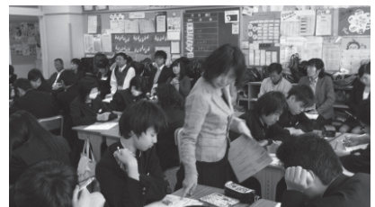
互いに学び高めあう中学生

*町では、居住地によって通学・通園できる小学校・幼稚園を定めていますが、特例により町内のほかの小学校・幼稚園へ通学・通園し、小規模校・園の特色を活かした授業・保育を受けることができる「通学区域の柔軟化対応モデル事業」を行っています。詳しくは教育委員会事務局学校教育課または各小学校・幼稚園へお問い合わせください。