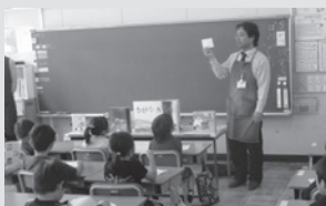
図書館司書の出前授業

主体的に学習し、心豊かでいきいきとした人生を築くことができるよう、人と人、人と社会のつながりを育みます。また、地域学校協働活動としてふるさと絆事業を進めていきます。