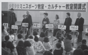
スポーツ・カルチャー教室

地域に開かれた学校づくり「地域ふれあいDAY」 幼稚園・小学校 11月25日(土) 中学校 11月3日(祝)ともに午前中