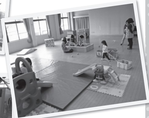
▲ 広いホールとたくさんの遊具