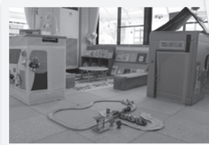
▲ 木や手作りのおもちゃ、絵本コーナー

つどいのひろば『ぽけっと』のイベント情報は、「広報ひの」や「子育て応援通信」ゆつくりおおきなあれ」でお知らせしています。「ゆつくりおおきなあれ」は役場や図書館、公民館等にも設置しています。また、町ホームページや日野めぐるでもお知らせしていますので、ご覧ください。 日野めぐるは次のQRコードから登録いただけます(子育て支援情報グループにて配信しています)。