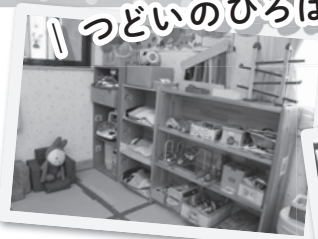
▲ たくさんの お人形や木のおもちゃ