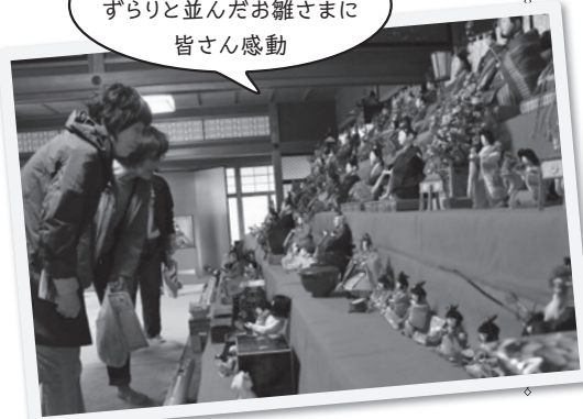
近江日野商人館では ずらりと並んだお雛さまに 皆さん感動

2月25日からは日野まちかど感応館内・ギャラリーつつむで川内倫子さんの写真展『someday for sure』が始まり、県内外から多くの方がギャラリーを訪れました。