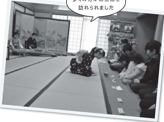
多くの方がお茶席を訪れました

子ども達は緊張しながらも日ごろ練習してきた成果を発揮していました。おいしいお茶と琴の演奏に、訪れた皆さんはゆったりと過ごされました。