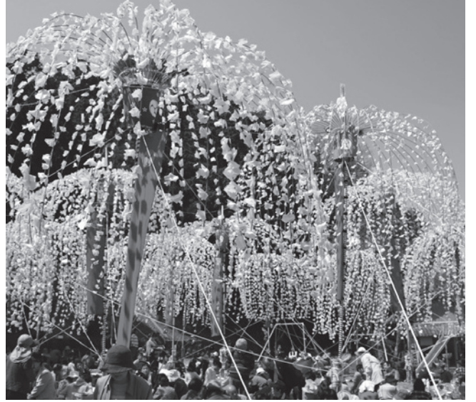
▲日枝神社(南山王宮)のホイノボリの祭り

ホイノボリは細長く割った数メートルの竹ひごに白やピンクの紙の花を付けた「ホイ」をのぼりの先から傘のように付けたもので、町内の7つの神社の春祭りで奉納されます。ホイノボリの祭りは日野町特有のもので、平成12年3月10日に県の無形民俗文化財(選択)になっています。