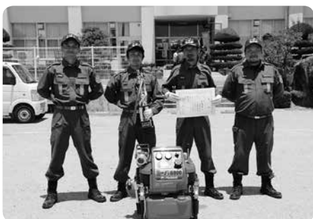
小型ポンプの部 優勝 第1分団Bチーム

は下記のとおりです。優勝チームの皆さん、おめでとうございます。また出場された消防団員の皆さん、お疲れさまでした。