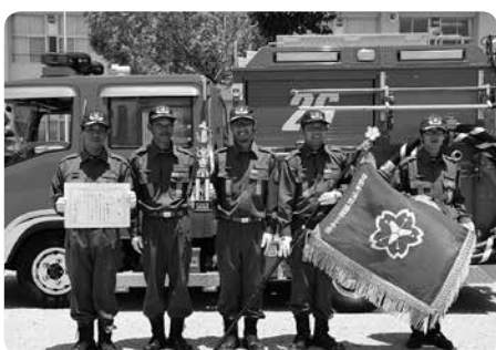
ポンプ車の部 優勝 第3分団