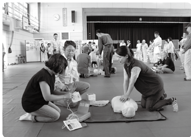
応急手当や心肺蘇生の方法を学びました