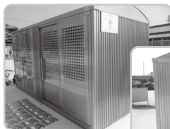
コミュニティ助成事業で整備した収納庫と草刈機