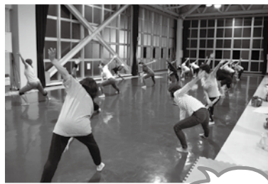
大人気のバレーボール