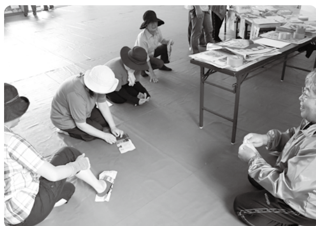
新聞紙を使つてのスリッパの作り方を学びました

9月2日（日）、大地震が発生したと想定し、桜谷小学校において日野町総合防災訓練が行われました。グラウンドでは被害情報の収集・伝達の訓練や対策本部、指定避難所の設置、地域住民の避難訓練が行われました。また、日野消防署救助隊により、地震の影響で車に閉じ込められた負傷者の救出救助訓練や災害時応援協定に基づく、関係機関による応急・救助・物資運搬等の訓練が行われました。