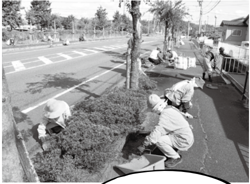
役場周辺で歩道の草むしりや清掃をする会員の方々

日野町シルバー人材センターでは、会員になって一緒に活動いただける方を募集しております。興味のある方は左記の連絡先にお問い合わせください。 ☎0748-5218911