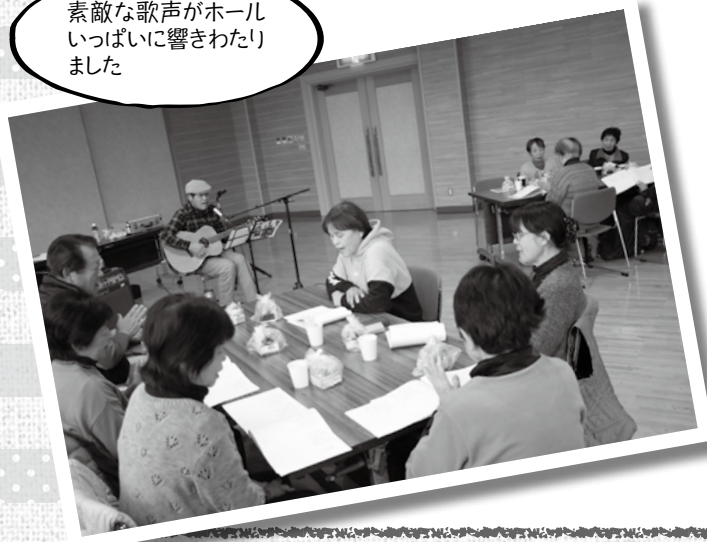
素敵な歌声がホール いっぱい響きわた りました

税金の大切さを学ぼう 桜谷小学校 税学習会 1月28日(火)〜31日(金)の間、町 内各小学校で日野町役場の税務課職員 が講師となり、税金が無い世界になる とどうなるのかを描いたアニメ「マリ ンとヤマト 不思議な日曜日」のDVD 上映や、税金の使い道、日野町の財政 状況などを学ぶ税学習会を行いました。 1月28日(火)に行われた桜谷小学校 の学習会で子ども達は「日野町だけ 35億円も税金が集まっています、でもそ れだけじゃ足りないことがわかった。 (もし税金が無くなると)今よりたくさ んお金を 使うこと がわかつ たので税 金は大事 だと思っ た」と話 してくれ ました。