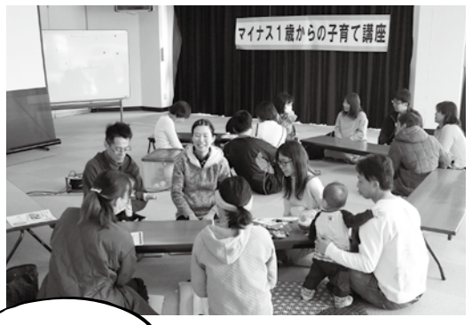
子育てについて 情報交換

身近なできごとや旬の話題を、企画振興課秘書広報担当 (役場1階・町長懇談室 ☎0748-52-6550)までお知らせください。 皆さんからの情報をお待ちしています!!