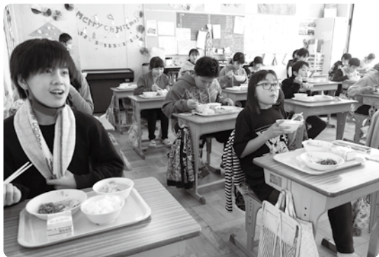
町内小中学校に受賞されたお米を寄贈

今回の大会では、全国から4,443検体が出品され、金賞受賞は18検体のみ。滋賀県内でコンクールの最高賞となる国際総合部門の金賞受賞は初めて