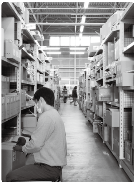
商品の棚入れ作業の様子

雇用だけでなく、就労体験の導入や企業見学、作業所とのつながりなど、さまざまな形で「働く」を応援されている和気産業株式会社さん。受賞、おめでとうございます。