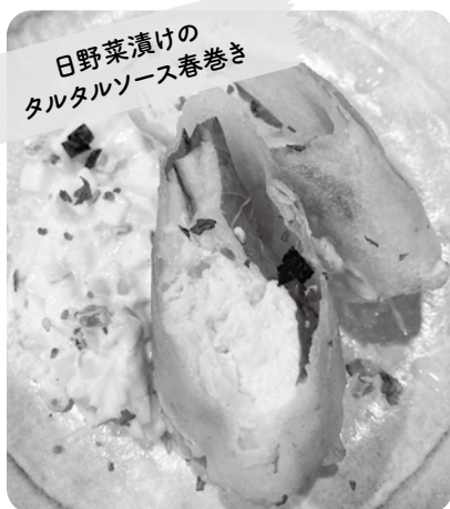
日野菜漬けのタルタルソース春巻き