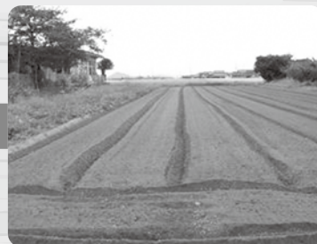
水はけの良い畑で...