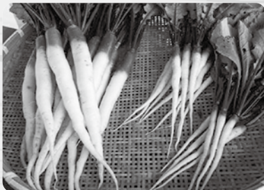
立派な日野菜ができました！