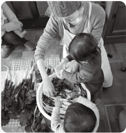
日野菜漬けワークショップに参加した親子

参加される方は、20代後半から40代の女性が多く、男性もおられます。参加された方からは、「子どもが日野菜漬けを大好きになってごはんをいっぱい食べるようになった」、「おいしいか