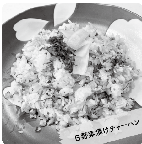
日野菜漬けチャーハン