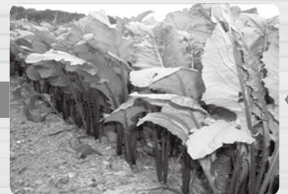
肥料をやって大きく…