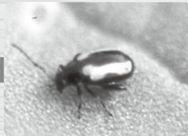
害虫や病気の対策を…