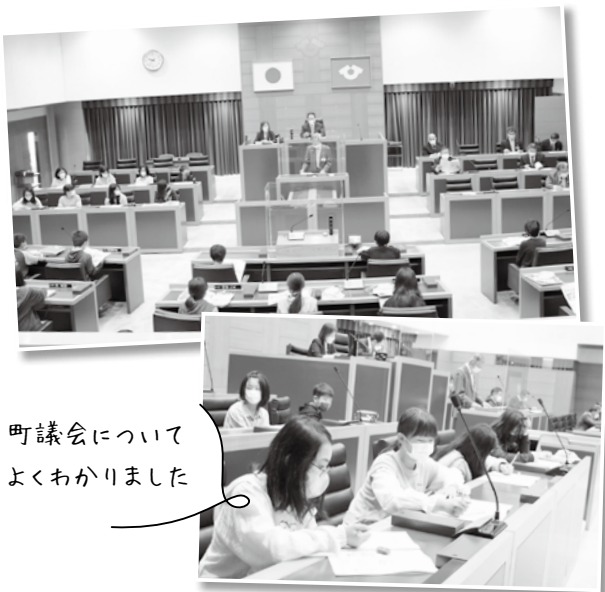
町議会についてよくわかりました