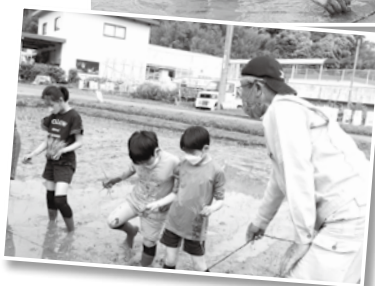
おいしいお米ができますように