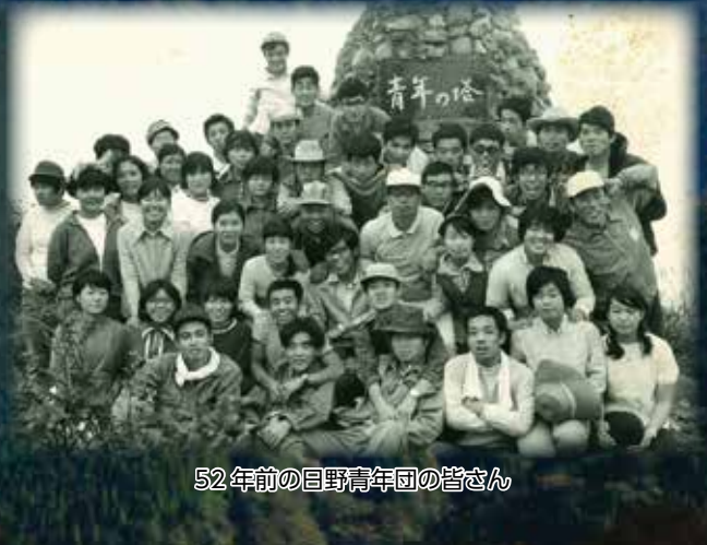
52年前の日野青年団の皆さん