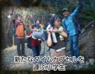
新たなタイムカプセルを運ぶ小学生