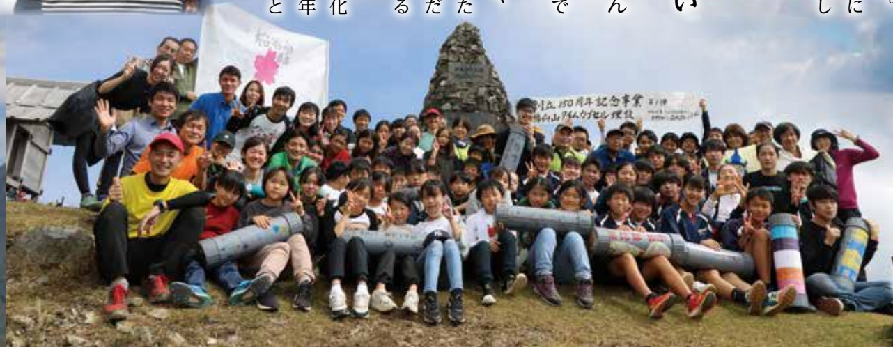
10月15日(土)のタイムカプセル埋設に携わった日野町連合青年会や関係者の皆さん