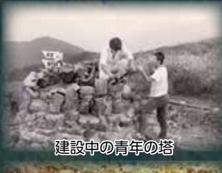
建設中の青年の塔