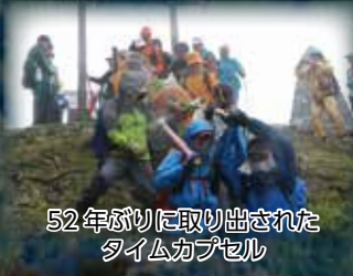
52年ぶりに取り出されたタイムカプセル