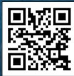
タイムカプセル埋設事業