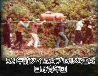
52年前タイムカプセルを運ぶ日野青年団