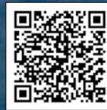
青年の塔建設記録