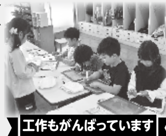
工作もがんばっています