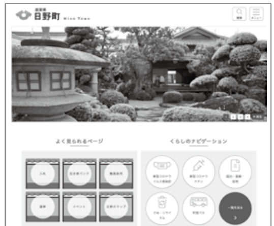
▶新しいホームページのイメージ

対応：デザインが崩れて表示された場合は、ページの更新(再読み込み)操作を行ってください。