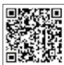
デジタル庁 ホームページ

※マイナポータルを通じて転出届の提出をした後は、別途、転入先市区町村の窓口で転入届などの手続きが必要です。詳しくはデジタル庁のホームページをご覧ください。