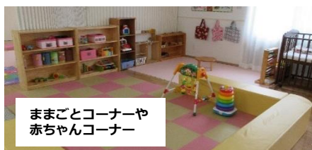
ままごとコーナーや 赤ちゃんコーナー