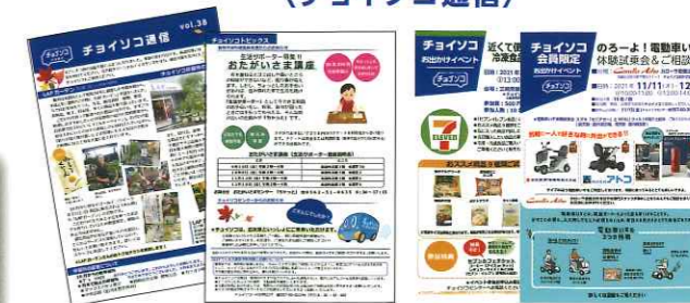
自治体様 イベント例