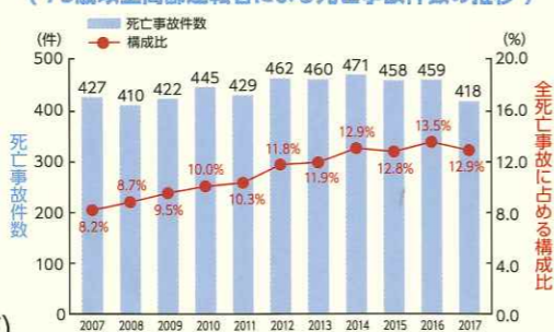
〈75歳以上高齢運転者による死亡事故件数の推移〉

後期高齢者の 運転による 死亡事故割合が 増加傾向で 12.9% 418件 (2017年現在)