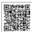
しがネット受付サービス

スマートフォンなどで下記の2次元コードを読み取り、画面の案内に従って入力し送信してください。