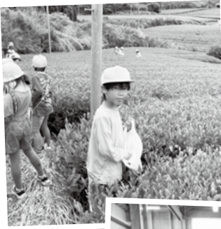
北山茶は 日野が誇る 銘茶！

児童に学習の感想をたずねると「茶摘みが一番心に残りました。摘むときにプチッと音がして楽しかったです」と話してくれました。