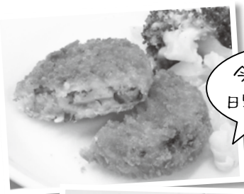
今までにない 日野菜レシピ☆

5月2日（火）の日野小学校の給食では、「まぜてく菜」を使った「日野菜漬入りコロッケ」を見守る児童たちが笑顔で食べていました。