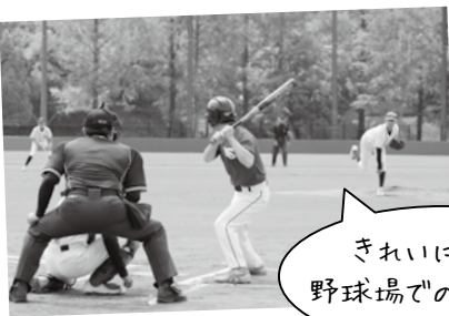
きれいになった 野球場での初試合！

記念大会では、テープカットや日野中学校野球部とOBとの交流試合が行われ「きれいになったので、これからまた試合をするのが楽しみです」と話してくれました。