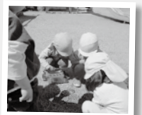
「ダンゴムシさんいるかな」

「いらっしゃいませ!」のかけ声をとって元気な子どもたち。他クラスの友達や先生がお客様として来てくれると、お店屋さんが盛り上がります。