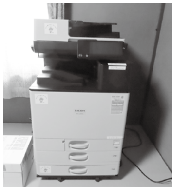
▲デジタルフルカラー複合機(中山西自治会)