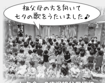
七夕会 3歳児祖父母招待

78名の子どもたちが毎日通っています。月齢は違いますが一人ひとりの“やりたい!”を引き出せる保育をめざし、子どもも保育士も元気いっぱいです。また保護者さんを巻き込んだあそびや地域のひととの交流を保育に活用しながら実体験を通じて学ぶ事、発見する事も大切にしています。