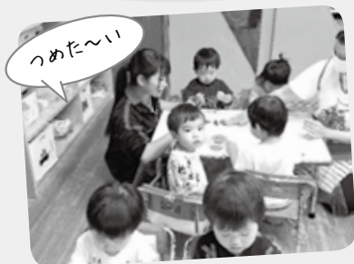
高校生インターンシップ 1歳児スライムあそび