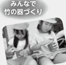
みんなで 竹の器づくり