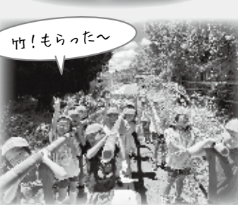
5歳児 みんなで竹取り この竹なにに変身するかな?