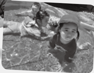
お水気持ちいいな♪