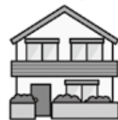
平成25年、30年住宅・土地統計調査結果の概要

調査票に記入していただいた内容を他に漏らしたり、統計以外の目的に使用したりすることは、統計法で固く禁じられています。安心してご協力ください。