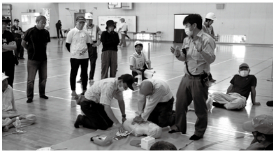
応急手当講習の様子