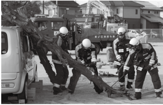
救出救助訓練の様子

被害情報の収集・伝達の訓練や災害対策本部、指定避難所の設置、地域住民の避難訓練が行われました。地元参加者の集団避難後には、土のう作成訓練、日野消防署による被災車両からの救助訓練、日野消防署・日野町消防団合同による住宅火災を想定した火災防衛訓練のほか、給水訓練や応援協定を締結している関係機関からの物資輸送