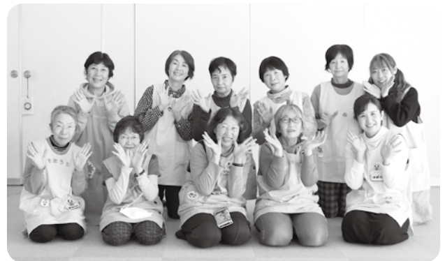
子育てサポーター

「親子がれすて」をはじめとする町主催の子育て支援事業の際に、子どもの見守りをしたり保護者のお話を聞くなど、町内で子育て中の方たちの「ちよっと先輩」としてサポートをされています。