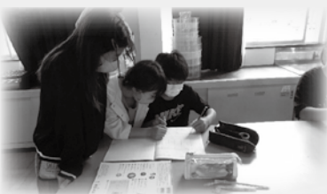
理科の授業 自分の考えを交流し、考えを深める

「わかった」「できた」「もっとやりたい」と感じ、学ぶ喜びが広がる授業づくりをテーマに校内研究をしています。目的をもって学習し、授業と家庭学習との往還により、学んだことを確実に身に付ける取り組みを進めています。