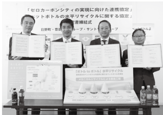
左から、サントリーホールディングス株式会社、日野町、豊田通商株式会社、豊通ペトリサイクルシステムズ株式会社

10月28日(土)、豊田通商株式会社と「ゼロカーボンシティの実現に向けた連携協定」を締結しました。また、豊通ペトリサイクルシステムズ株式会社、サントリー食品インターナショナル株式会社、サントリーホールディングス株式会社と「ペットボトルの水平リサイクルに関する協定」の締結を行いました。