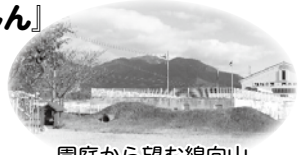
園庭から望む綿向山

昭和27年に開園され、今年度は、3歳児6名、4歳児2名、5歳児7名の園児15名が在籍している小規模の幼稚園です。綿向山をバックに西大路の恵まれた豊かな自然の中で、毎日元気に活動しています。園児数が少ない分、より地域のさまざまな『人・もの・こと』との出会いを大切に、多くの体験を楽しみ、「やってみたい」、「やってみよう」と心を動かして学びにつながる保育をめざしています。