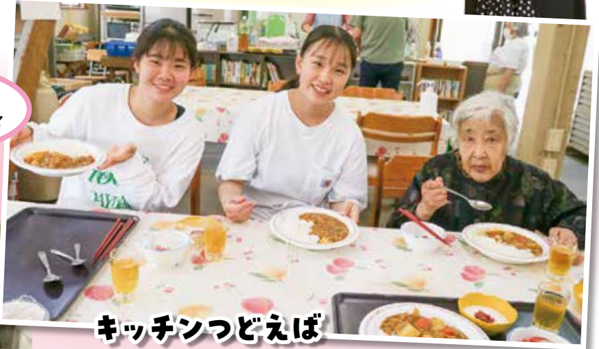
キッチンつどえば