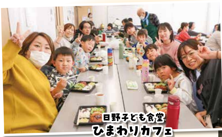
日野子ども食堂 ひまわりカフェ