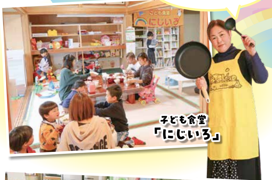
子ども食堂 「にじいろ」