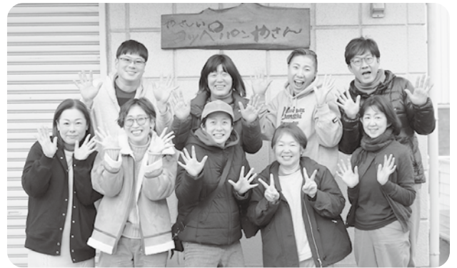
▲「ひのみんなの食堂」運営団体の皆さん

のつながりが強く、行動力があることも日野町ならではの特色だと思えます」と話されました。