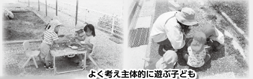
よく考え主体的に遊ぶ子ども

安心できる大人に見守られ、子どもたちは園で同年齢や異年齢の友達、そして職員との関わりの中、一緒に笑いあったり、思いが通じる喜びを感じあったり、時には我慢をしたり、折り合いをつけたりしながら、人と関わる楽しさやうれしさを感じていきます。