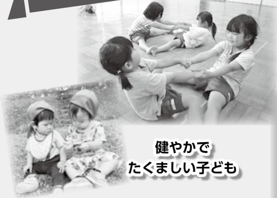
健やかで たくましい子ども

就学前教育保育では生活や遊びの中で「もっとやりたい」「もっとこうしたい」と心を動かし、そのためにどうすれば良いかを自分で考え、選択し、行動し、子どもが主体性をはぐくめるように保育を行っています。また、いろいろな経験や繰り返しの体験をして、生きる力の土台をはぐくんでいくことを大切にしています。