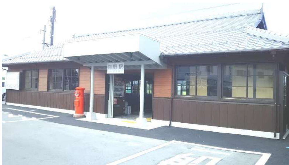
再生した近江鉄道日野駅舎