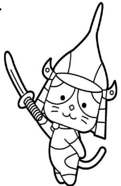
蒲生氏郷公顕彰会公認キャラクター