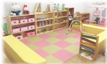
「赤ちゃんコーナー」