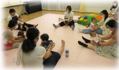
ふれあい遊び ♪おすわりや~すいすどっせ♪