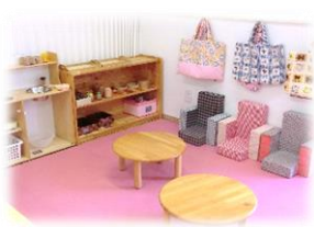
「ままごとコーナー」