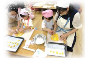
↑おやつ作り ←新聞遊び