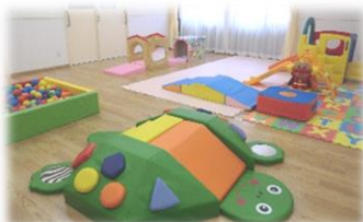
「運動あそびコーナー」