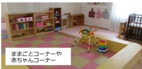
ままごとコーナーや赤ちゃんコーナー