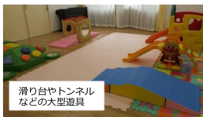
滑り台やトンネルなどの大型遊具