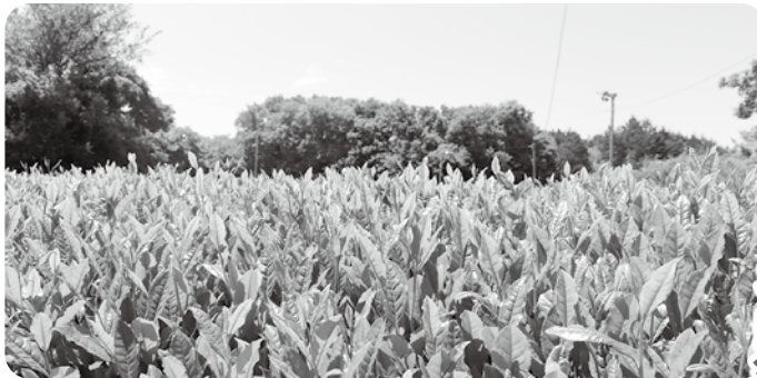
日野が誇る銘茶 北山茶