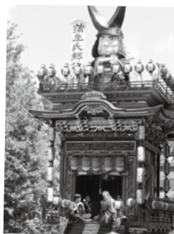
宵祭も本祭も 見どころいっぱい！

3日の本祭では、馬見岡綿向神社に集結した豪華絢爛な曳山を一目見ようと、たくさんの方でにぎわいました。辺りでお神輿の「ヤレヤレ、ドントヤレ」と威勢の良い掛け声や曳山で演奏される祭囃子が響き、お祭りを盛り上げていました。町なかでは、栈敷窓から顔を出してお神輿や曳山を見る家族、友達とおしゃべりしながら屋台で買ったかき氷やフライドポテトを食べ歩く人など、年に一度のお祭りを楽しむ人の姿がたくさん見られました。