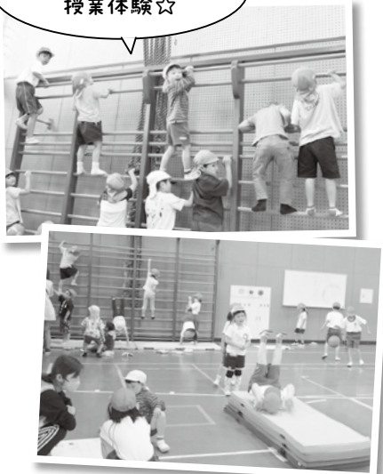
楽しく交流しながら 授業体験☆

園児たちに感想を聞くと「楽しかった！」「初めて来たけどおもしろかった」「1年生が優しくしてくれた」と笑顔で答えてくれました。