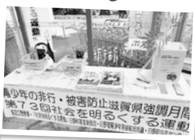
（昨年7月の「青少年の非行・被害防止滋賀県強調月間」における街頭啓発の様子）