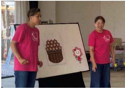
花咲きママさん (昨年の親子ふれすての様子です)