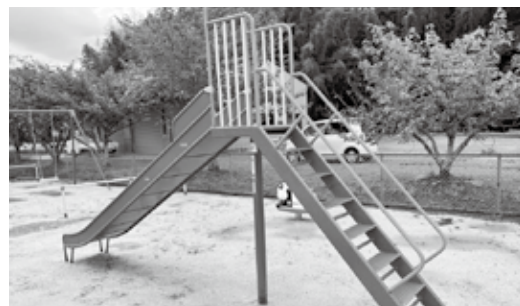
▶整備された公園のすべり台

この整備によって、地域のみなさんがより集いやすくなり、コミュニティ活動の一層の充実が期待されます。