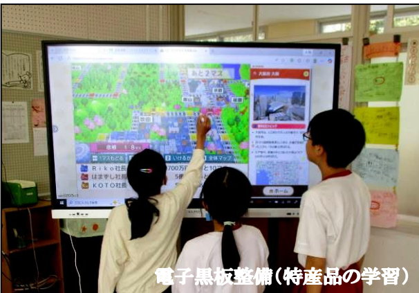
電子黒板整備(特産品の学習)