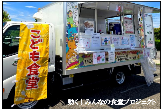
動く！みんなの食堂プロジェクト