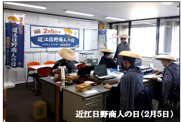
近江日野商人の日(2月5日)