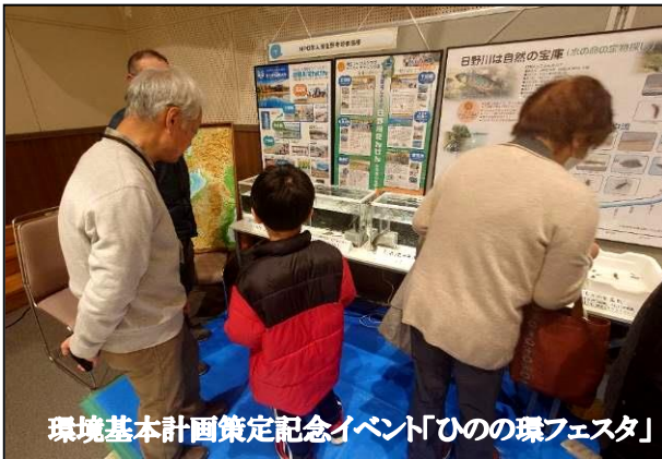
環境基本計画策定記念イベント「ひのの環フェスタ」