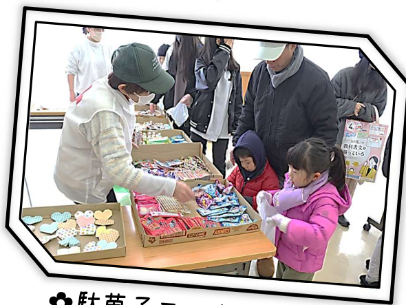
❁駄菓子コーナーにて❁