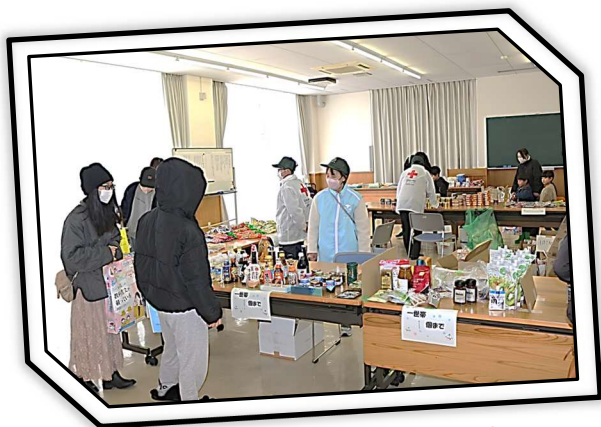
❁食品コーナーにて❁