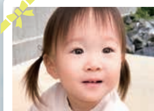
2歳のお誕生日おめでとう♡ いつまでも可愛いこちゃんていてね