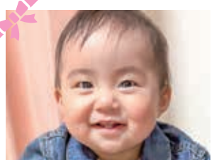
1歳のお誕生日おめでとう♡ 元気にすくすく育ってね♪