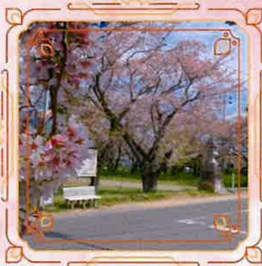
④ひばり野公園 ※公園北側のひばりの会館 駐車場が利用可能