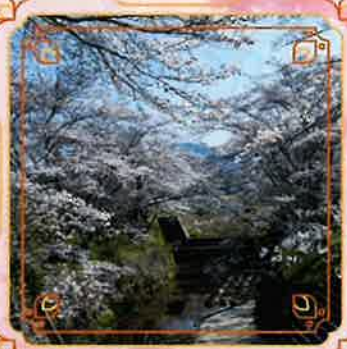
②川原農業倉庫付近 ※橋の手前に数台駐車可能