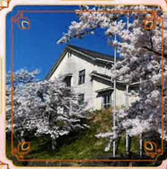
①しゃくなげ学校 (旧鎌掛小学校)