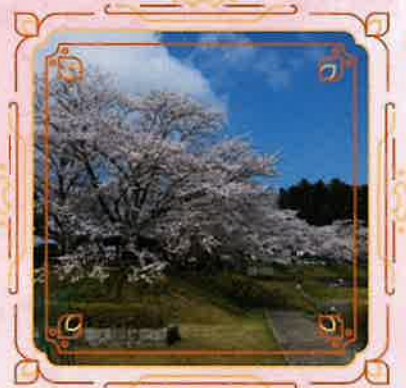
⑤日野川ダム駐車場付近