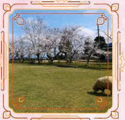
③滋賀県立畜産技術振興センター ふれあい広場付近