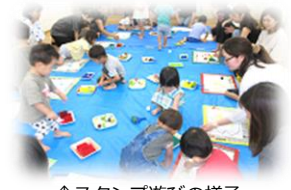
↑スタンプ遊びの様子

同じくらいの年齢のお子さんや保護者が集まって、親子一緒に遊んでいます。ご家庭では経験しにくいような遊びもみんなで楽しんでいます。