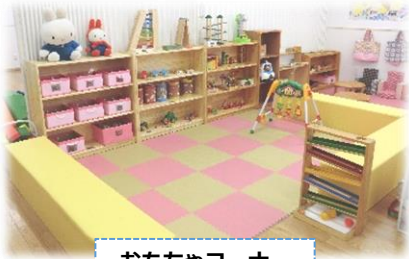
おもちゃコーナー