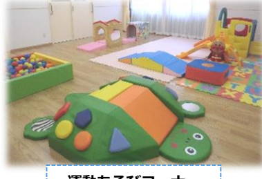
運動あそびコーナー