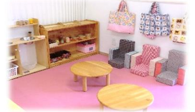
ままごとコーナー