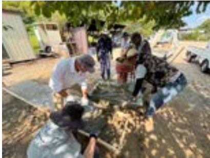
コンクリート打ち

8月30日に基礎コンクリート打ち、9月20日にレンガ積みと上板製作、その後若干の仕上げ作業を経て、当初思い描いたものが出来上がったと思っています。その間9月上旬には、 さんのご尽力で、上に覆い被っていた樹木の枝伐採も終える事ができました。