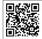
受講申込フォーム