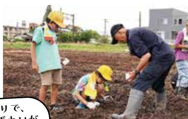
満開のひまわりで、 地域に笑顔とにぎわいが 広がりますように

当日は、児童たちが丁寧に種をまき、「大きく育ってほしい」「夏に満開のひまわりを見るのが楽しみ」と話しながら作業を進めていました。8月には、一面に咲き誇るひまわりが地域を明るく彩りますので、ぜひご覧ください。