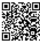
家屋用途変更申告書