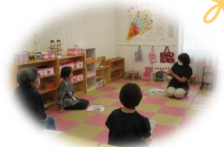
〈昨年の講座の様子〉